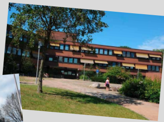
Haus der Jugend