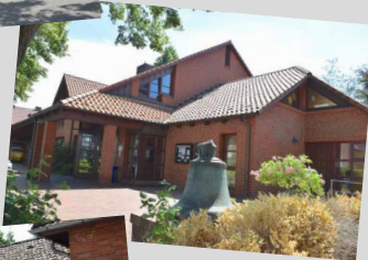
Ev.-Luth. Kirchengemeinde Quickborn-Hasloh