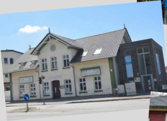
ATS Suchtberatungstelle „Pavillon“