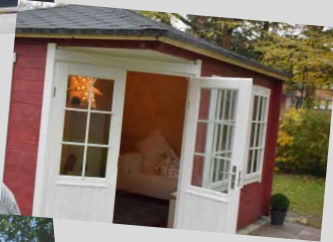
DRK Familienzentrum Quickborn